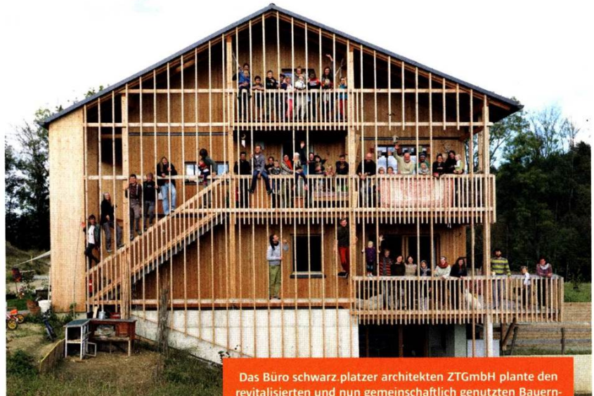
Das Büro schwarz.platzer architekten ZTGmbH plante den revitalisierten und nun gemeinschaftlich genutzten Bauernhof beim Projekt KooWo Volkersdorf in der Nähe von Graz

„Wir investieren sehr viel in ländlichen Gegenden, die sich besser umsetzen lassen als Projekte in den Städten“, beurteilt Eichinger. „Denn regionale Investoren wollen ihrer Region oft etwas zurückgeben. Bürgermeister sind zudem bedacht, dass ihre Einwohner in der Region bleiben können.“